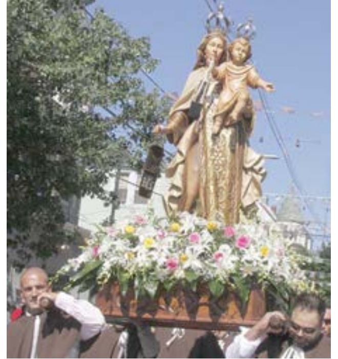
Na foto acima, o andor com a imagem da padroeira, Nossa Senhora do Monte Carmelo, transportado pelos paroquianos durante a procissão na tarde do passado domingo em New Bedford.

habitualmente se concentra a comunidade, para assistir ao desfile da procissão.