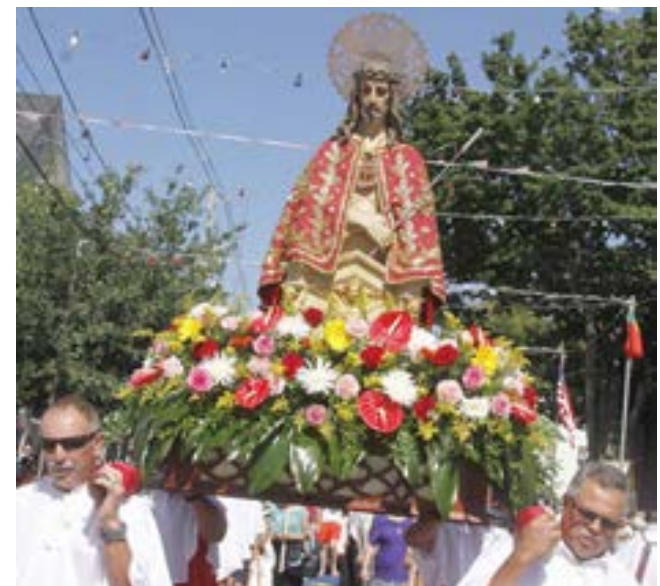
Na foto acima, o andor com a imagem do Senhor Santo Cristo. Na foto à esquerda, a imagem de São José.