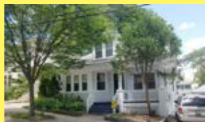
Bungalow EAST SIDE $329.900