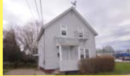
2 famílias EAST PROVIDENCE $129.900