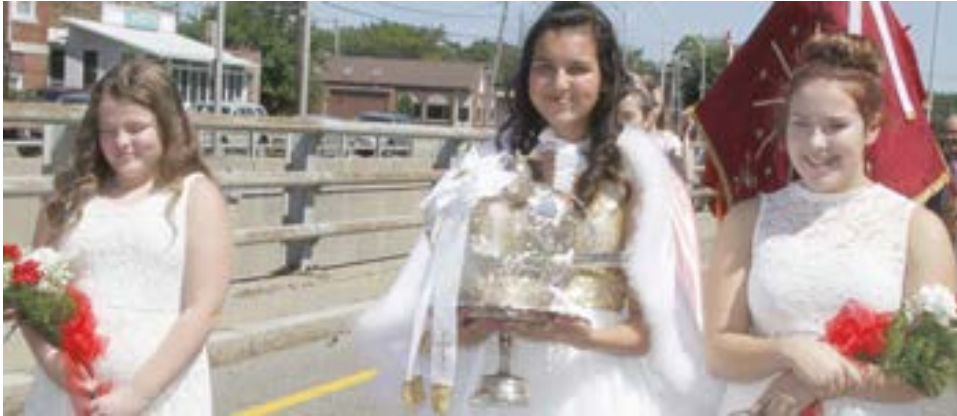
Uma das coroas do Império Mariense.