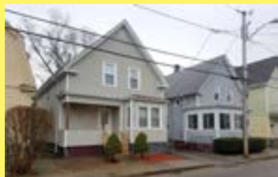
Cottage CRANSTON $159.900