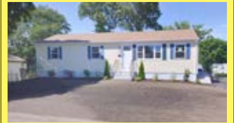
Ranch EAST PROVIDENCE $254.900