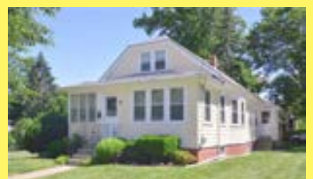
Bungalow KENT HEIGHTS $239.900