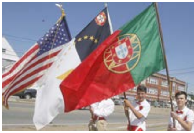
As bandeiras que abriam a procissão para a igreja de São Francisco Xavier.