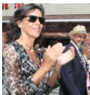
Fotos captadas pelo nosso repórter Augusto Pessoa durante a parada madeirense do Santíssimo Sacramento em 2016.