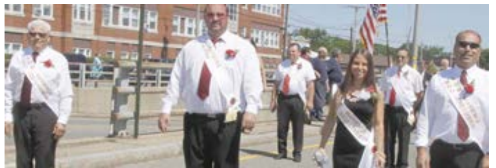
Corpos diretivos do Império Mariense de East Providence, que esteve em festa no passado fim de semana mantendo a tradição da terceira pessoa da Santíssima Trindade que ali continua a reviver-se anualmente.