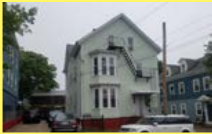
3 famílias FOX POINT $439.900

• Várias casas à venda • Preços baixos • Juros continuam baixos