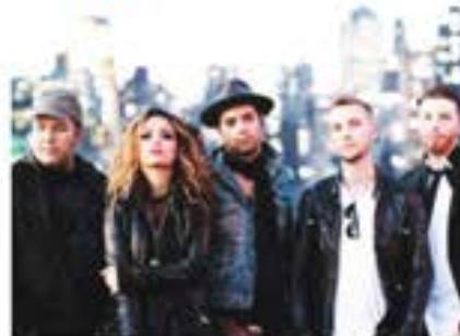
SABADO DE AUGUST 5 Artistas de gravação portugueses MENAGE