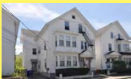
3 famílias PAWTUCKET $189.900