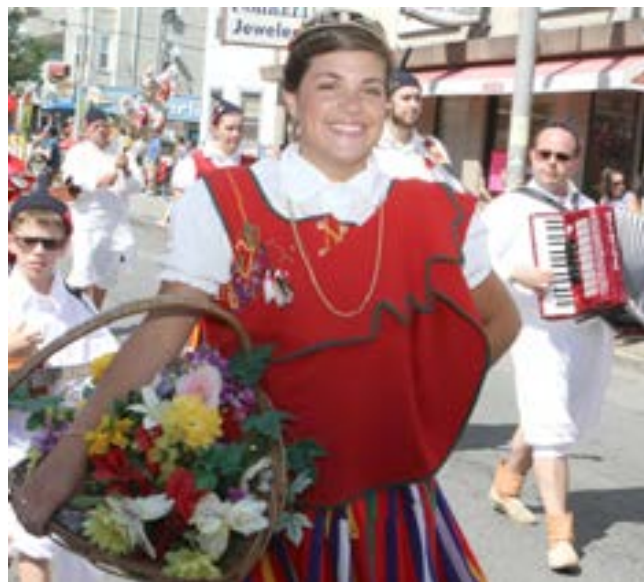
Park em direção ao Madeira Field.

Um dos pontos altos é a parada que desfila pela Acushnet Ave. Tem lugar domingo, pelas 2:00 da tarde do dia 6 de agosto com saída do Brooklawn