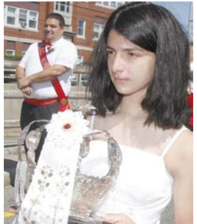
A coroa da Irmandade do Espírito Santo do Campo do Tio Mateus, Rehoboth na procissão do Espírito Santo do Império Mariense de East Providence.