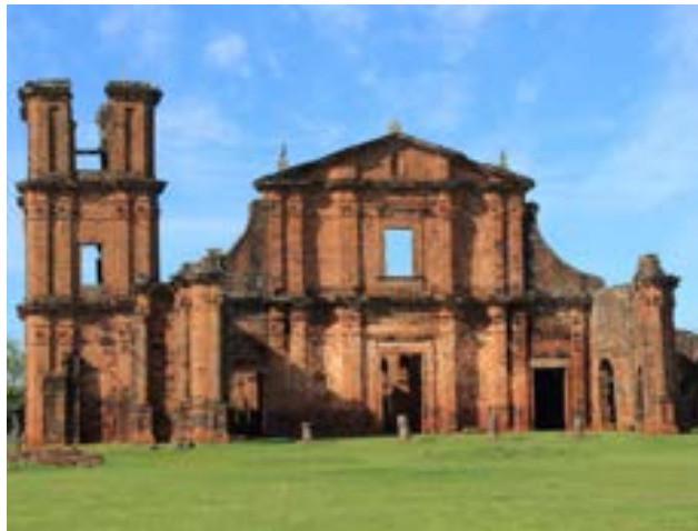
Ruínas da missão de São Miguel Arcanjo, Los Angeles.