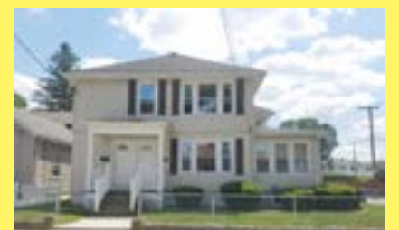
2 famílias PAWTUCKET $259.900

Contacte-nos e verá porque razão a MATEUS REALTY tem uma excelente reputação