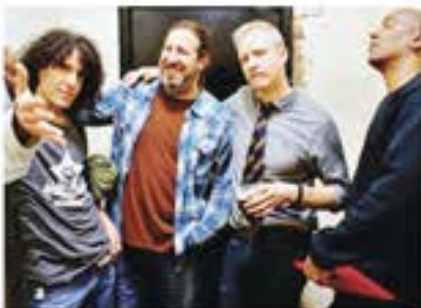
QUINTA-FEIRA DE AUGUST 3 BILLBOARD Revista vencedores SPIN DOCTORS

ENTRADA GRATIS! Comida Portuguesa e Vinho da Madeira