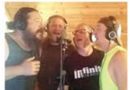
DOMINGO DE AUGUST 6 Estrelas de Nashville RAVEN CLIFF

Ainda: Grupo Folclorico do Clube Madeirense S.S. Sacramento e entretenimento sem parar em cinco palcos!