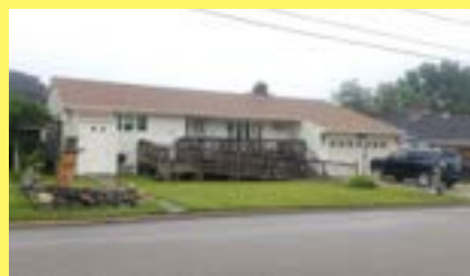
Ranch KENT HEIGHTS $319.900