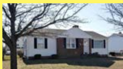
Ranch EAST PROVIDENCE $219.900