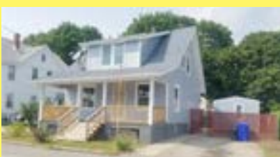
Cottage PAWTUCKET $209.900