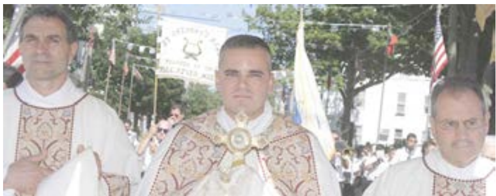
O clero na procissão.