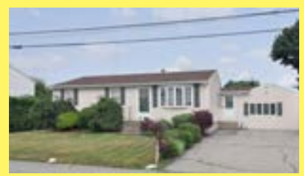
Ranch EAST PROVIDENCE $269.900