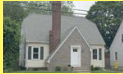
Cape RIVERSIDE $239.900