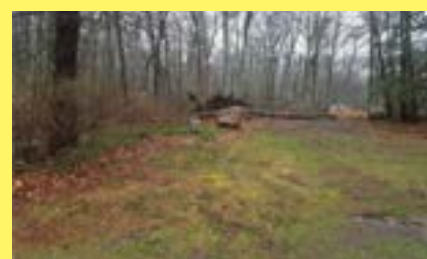
Terreno REHOBOTH $169.900