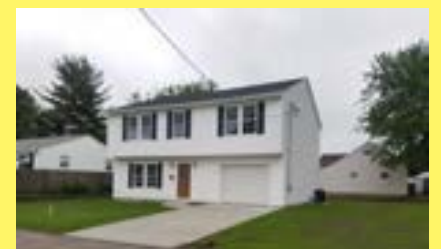
Colonial EAST PROVIDENCE $279.900