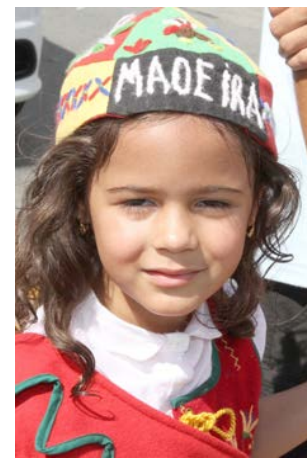
sário muito trabalho de preparação que perdura durante um ano e que naturalmente vai-se acentuando com o aproximar do evento.