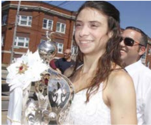
Nas fotos acima e abaixo, representação do Império Mariense de Bridgewater.