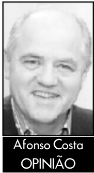
Afonso Costa OPINIÃO

Semanas antes de morrer o saudoso Eusébio disse que “a década de sessenta foi a melhor de sempre”, recordando na altura um Benfica de peso europeu e a invasão musical desse eterno conjunto de rapazes com cabeleira de rapariga a que deram o nome de Beatles.