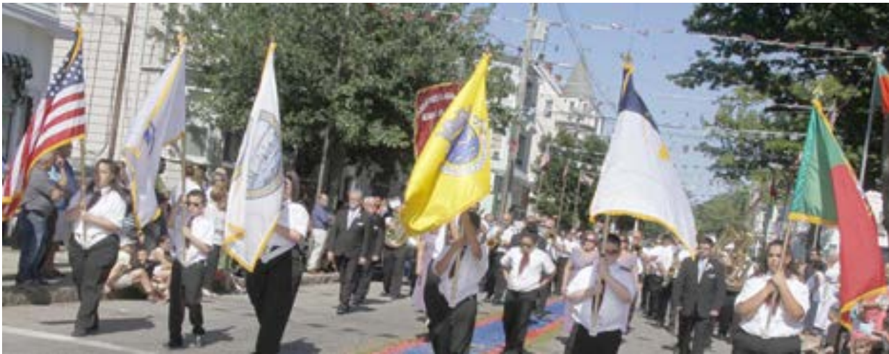
A Banda do Senhor da Pedra, de New Bedford, foi uma das que abrilhantou a procissão da festa da igreja de Nossa Senhora do Monte Carmelo, no sul da cidade baleira.