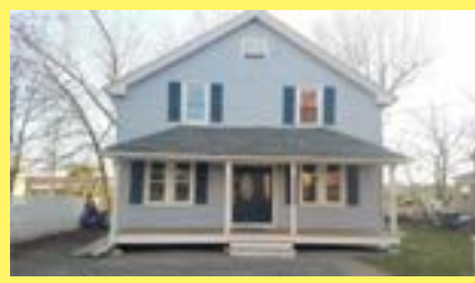
Cottage PROVIDENCE $164.900