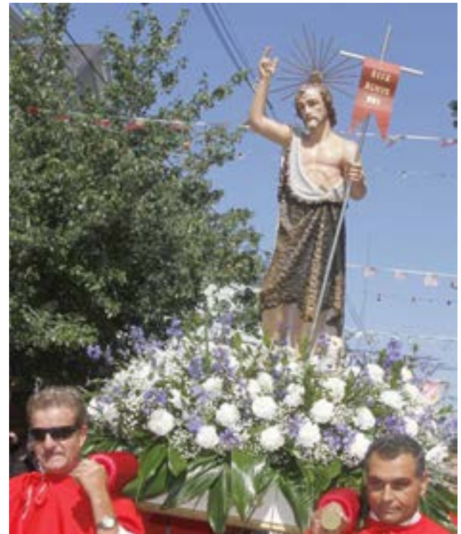
Na foto abaixo, o andor com a imagem de São João.