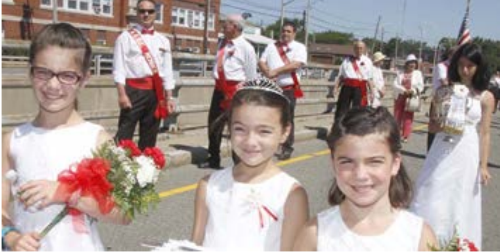
A Irmandade do Espírito Santo do Campo do Tio Mateus esteve numerosamente representada nas festas do Império Mariense de East Providence.

• A festa mais tradicional do Espírito Santo acontece de 18 a 20 de agosto